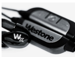
【合體當新嘢？】WESTONE 首款藍牙耳機 WESTONE WX