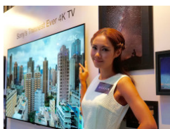
旗艦級 BRAVIA 4K 率先睇