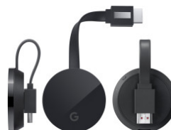
【大神爆料】CHROMECAST 玩 4K 影音串流